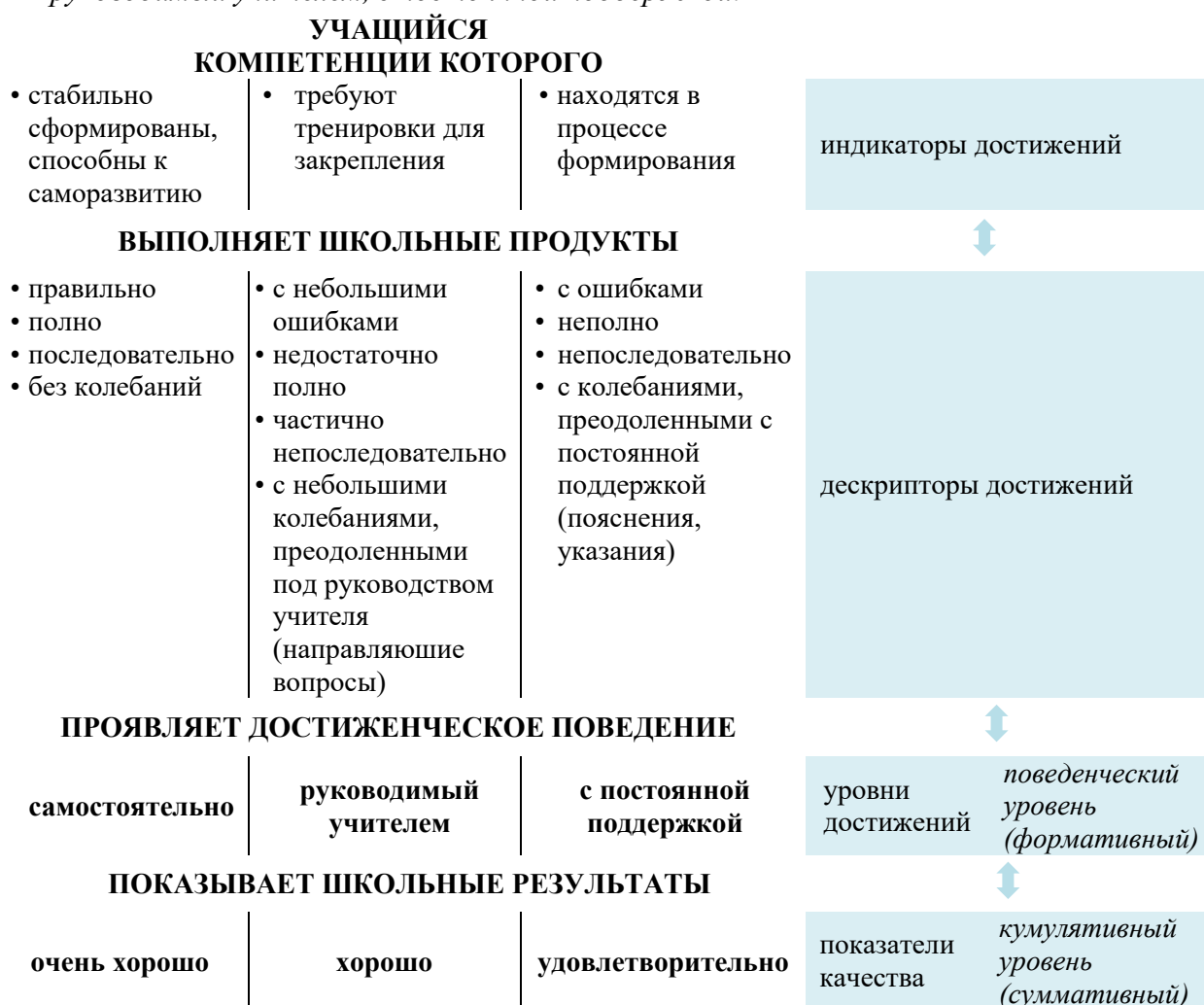
Фигура 1. Соотношение кумулятивного и поведенческого уровней оценки школьных результатов в контексте КОД

КОД вписывается в парадигму формирующего оценивания, поэтому приоритетным является формативный уровень оценки школьных результатов – достиженческое поведение учащихся . Таким образом, младший школьник получает шанс на успех обучения в удобном темпе и в индивидуальном контексте развития личности.