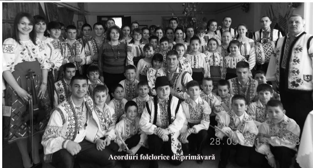
28.03.2013 14:38 Acorduri folclorice de primăvară

Actualmente, Liceul Teoretic „Ion Creangă” din or. Ungheni are pe liste 748 de elevi, dintre care: la ciclul primar – 269 elevi, la treapta gimnazială – 331 elevi și, respectiv, în clasele liceale