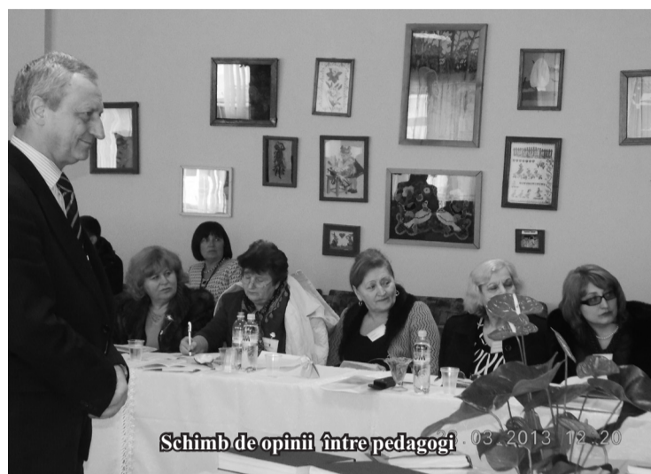
Schimb de opinii între pedagogi 03.2013 19:20

La prima vedere nonconformist, genericul amintit mai sus a constituit un punct de reper considerabil în organizarea, de către Institutul de Științe ale Educației din mun. Chișinău, a unui workshop de specialitate. De data aceasta, acțiunea s-a produs în teritoriu, cu aportul mai multor instituții cu pondere, și anume: Centrul de Excelență Didactică din cadrul IȘE, în colaborare cu Direcția Raională de Învățământ, Tineret și Sport Ungheni, Ministerul Mediului din RM și Liceul Teoretic „Ion Creangă” din or. Ungheni. Prezența la întrunire a oaspeților de onoare din cadrul Casei Corpului Didactic și inspectoratului din Bistrița-Năsăud, România, a conferit acestui eveniment importanță majoră, fiecare dintre invitați având misiuni care, spre final, s-au realizat completamente. Menționăm că între 28-29 martie, curent, organizatorii au abordat aspecte relevante vizând creativitatea în cadrul demersului educațional ca și oportunitate de valorificare a potențialului elevului de astăzi.