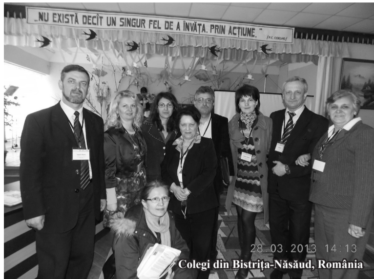
28.03.2013 14:13 Colegi din Bistrița-Năsăud, România

câte ori ne vizitează disponibilitatea de a-și împărtăși experiența. Seminarul a avut ca scop formarea de atitudini, dezvoltarea de competențe, menite să determine manifestarea unei conduite profesionale. Temele abordate au vizat, cu preponderență, comunicarea managerială, rolurile și calitățile manageriale, parteneriatul comunitar, asigurarea calității, managementul schimbării, analiza necesităților, managementul de proiect.